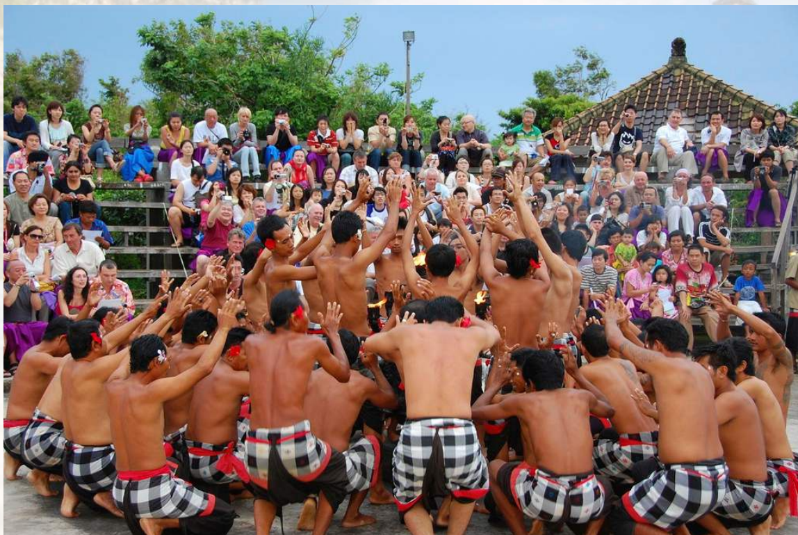
Kecak-előadás Uluwatunál.