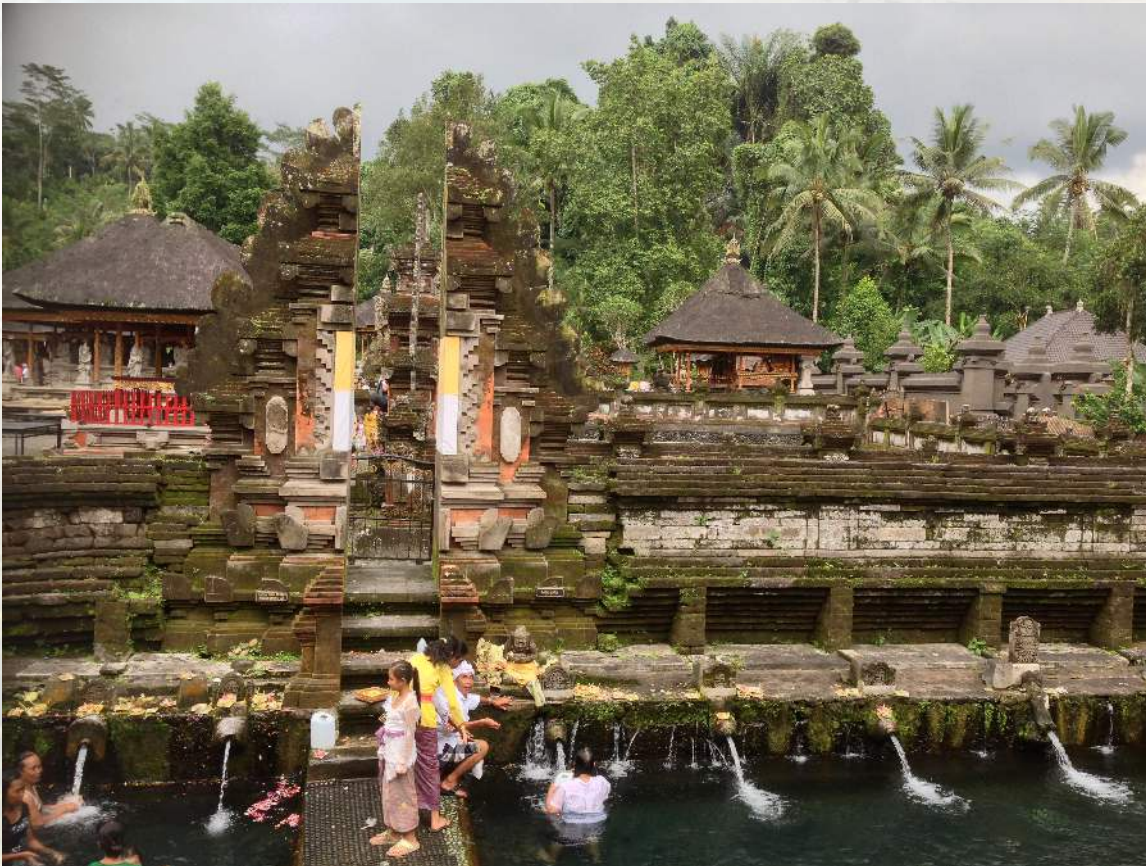
Tirta Empul víztemploma, a melukat élményének egyik legismertebb helyszíne.

Amirul tippje: Melukatot csak akkor válasszatok, ha valóban nyitottan és tisztelettel érkeztek. Nem kell mindent kipróbálni csak azért, mert fotogén.