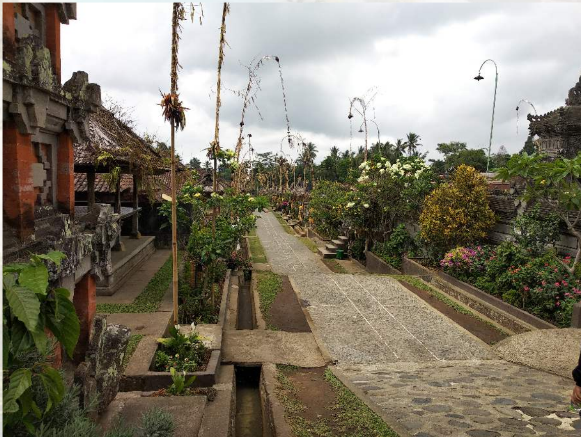
Hagyományos falusi környezet Balin - jó háttér a közösségi és kézműves élményekhez.