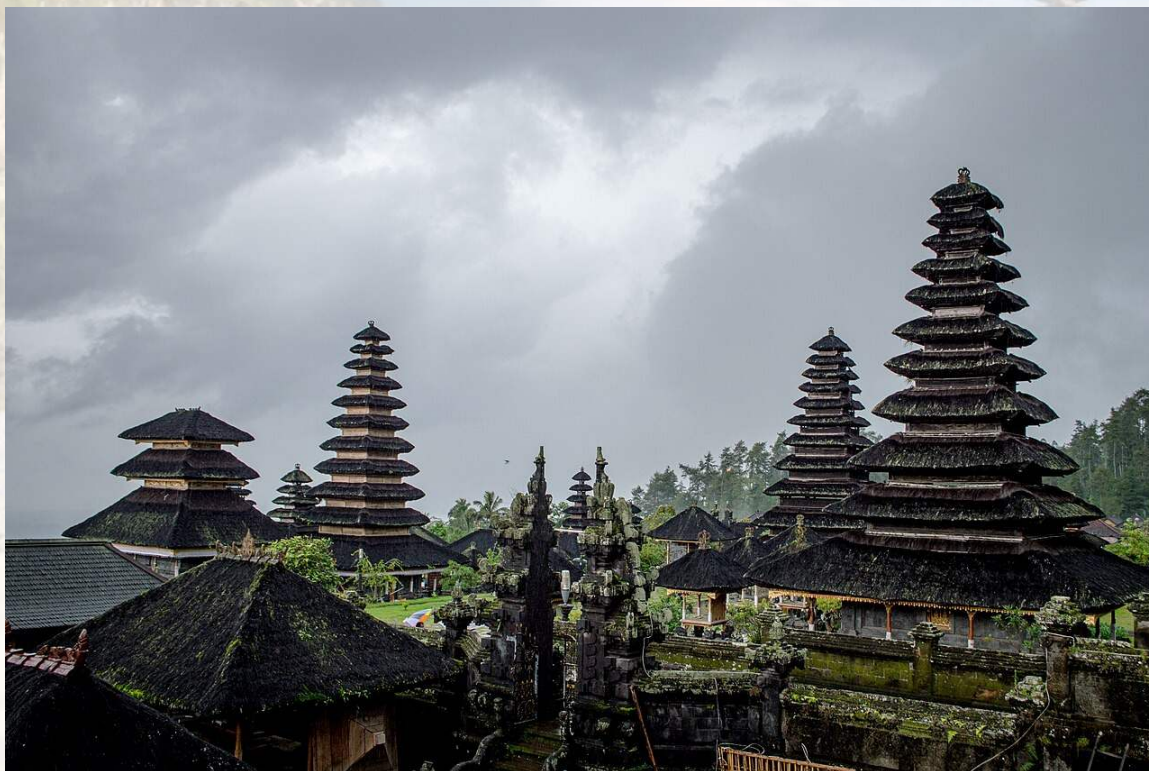
Templomi közeg Balin - a vallási tér a mindennapi kultúra része.