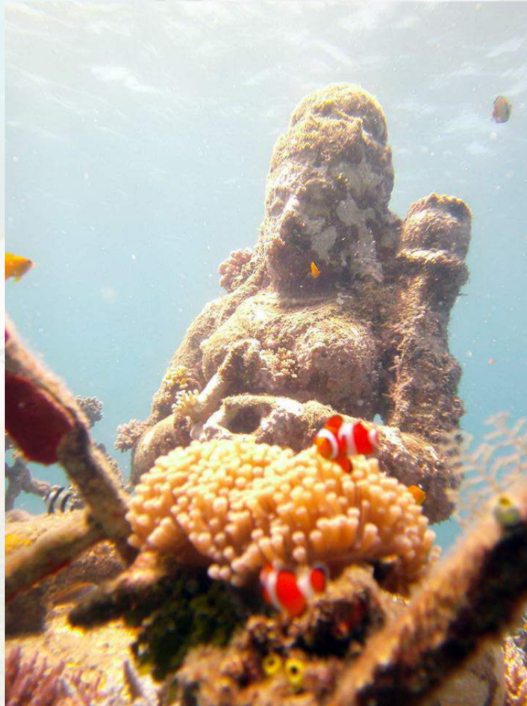
Kép: Ennio morricone / Wikimedia Commons / CC BY-SA 3.0.

Pemuteran Bali északnyugati részének nyugodt tengerparti bázisa, távol a déli régiók sűrűségétől. A part barátságosabb, lassabb, kevésbé látványosan "instás", viszont éppen ettől pihentető. A környék ismert a korall-helyreállítási törekvésekről és a víz alatti programokról, így azoknak különösen jó választás, akik a természetet nem csak háttérként, hanem valódi élményként keresik.